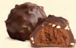
Chocolat noir 60% de cacao