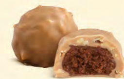
Chocolat blanc caramélisé