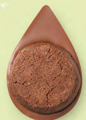
BISCUIT BROWNIE Chocolat au lait 35% de cacao