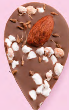
LE SONGE DE JULIETTE Chocolat au lait 35% de cacao, amande, éclats de nougat, brins d'anis