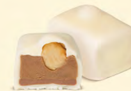
Duo praliné noisettes et crème au beurre au café, avec sa noisette caramélisée