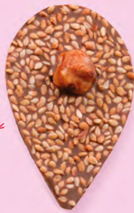
GRAINE DE JULIETTE Chocolat au lait 35% de cacao, sésame, noisette caramélisée