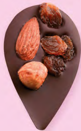
JULIETTE IN THE CITY Chocolat noir 60% de cacao, amande, noisette, raisins secs