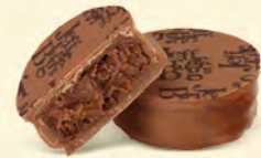
SAINT-DOMINGUE Chocolat au lait 36%