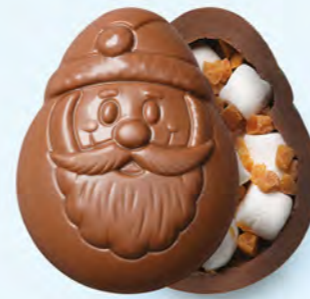
CHOCOLAT AU LAIT Guimauve et éclats de caramel