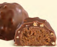
Chocolat au lait 36% de cacao

Éclats croustillants, praliné ultra fondant, finesse du chocolat d'enrobage... les rochers sont les grands classiques de notre maison.