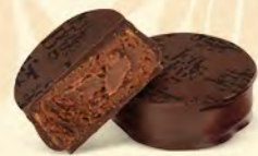
VENEZUELA Chocolat noir 70%