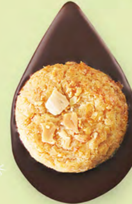
BISCUIT AMANDES Chocolat noir 60% de cacao