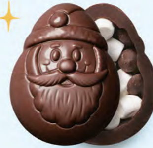
CHOCOLAT NOIR Guimauve et pépites de chocolat