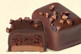
Duo gianduja noisettes et crème au beurre chocolat noir