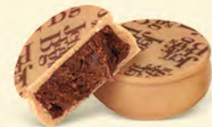
ÉQUATEUR Chocolat blanc caramélisé