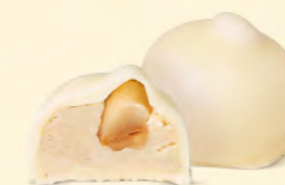
Crème au beurre à la vanille et sa noisette caramélisée

La crème de la crème des recettes de chocolat belge. Pour les connaisseurs de chocolats onctueux.