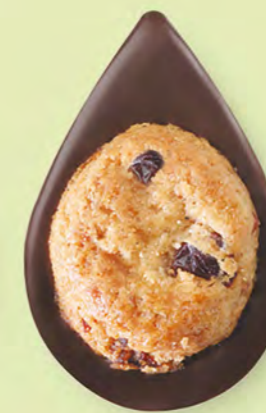
BISCUIT CRANBERRIES Chocolat noir 60% de cacao