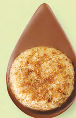
BISCUIT NOISETTES Chocolat au lait 35% de cacao

Un biscuit sablé artisanal posé sur un très bon chocolat ! C'est simple et c'est divin.