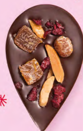
JULIETTE & TOM Chocolat noir 60% de cacao, dés d'abricots secs, amandes caramélisées et morceaux de cerise