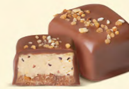
Duo gianduja noisettes et crème au beurre avec éclats de fèves de cacao et de noisettes